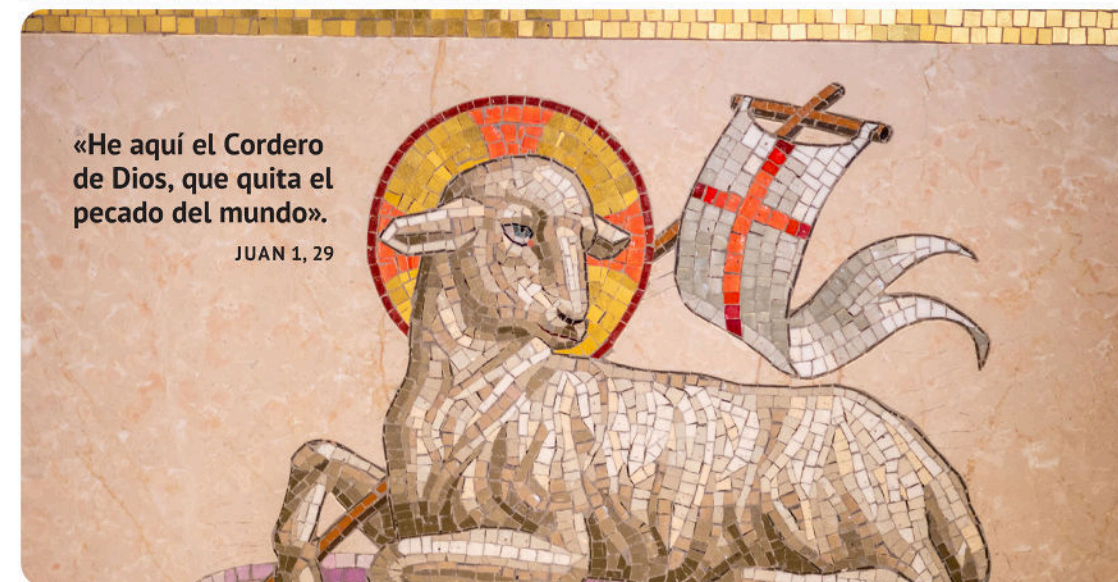
© 2026 LIGUORI PUBLICATIONS, UN MINISTERIO DE LOS REDENTORISTAS

¿Qué interpretación del «Cordero de Dios» me resuena más?